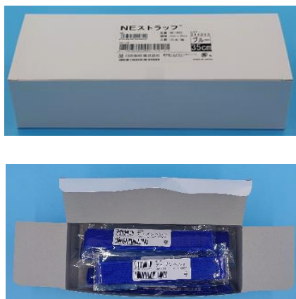
旧パッケージ (2022年12月まで)